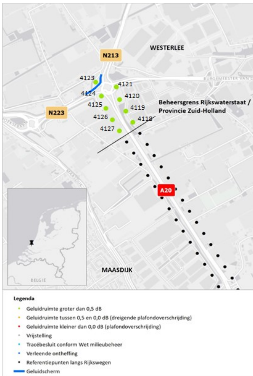
Figuur 2 Geluidruimte naleving 2022 t.o.v. geldende geluidproductieplafonds provinciale wegen