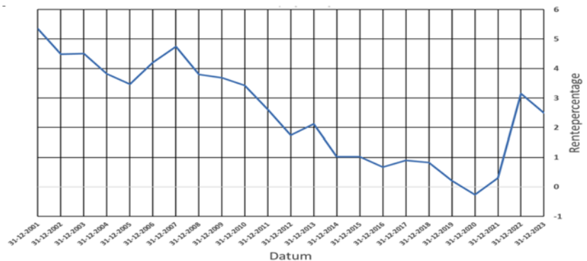
Figuur 2: Nominale rentetermijnstructuur pensioenfondsen (zero coupon) looptijd 10 jaar 1

Het is niet verstandig om een vloer van 2% rekenrente of een variabele rekenrente met een bandbreedte van 2%-3% te hanteren. Na de financiële crisis is zichtbaar geworden dat de rente ook voor langere periodes lager dan 2% kan zijn. In zo'n situatie zou dat, met de genoemde vloer voor een variabele rekenrente, betekenen dat met een hogere rekenrente gerekend wordt dan de rente die feitelijk op de markt wordt vergoed. Dat zou tot gevolg hebben dat de hogere pensioenen als gevolg van de hogere rekenrente worden ingerekend en uitbetaald aan de gepensioneerden terwijl het risico door de jongere deelnemers in een pensioenfonds nog moet worden gelopen. Dit leidt tot herverdeling van jong naar oud. De regels van toekomstbestendig indexeren voorkomen dit en zorgen ervoor dat pensioenen ook in de toekomst betaald kunnen blijven worden.