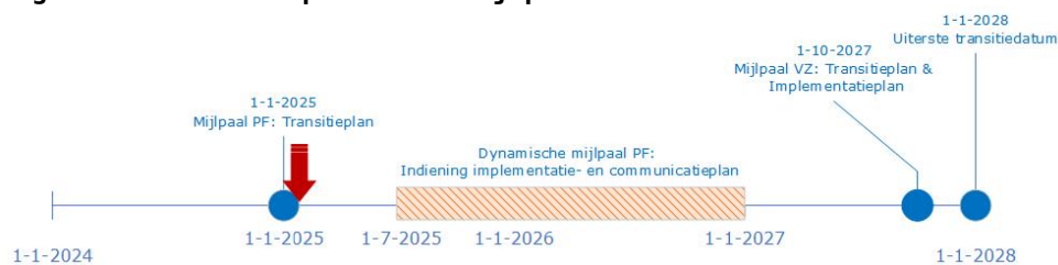
Figuur 1: Transitieperiode – mijlpalen